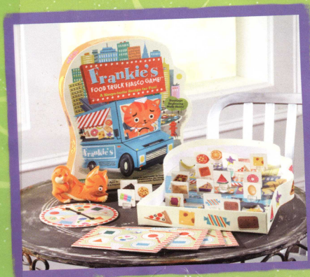
EI-3414 Frankie's Food Truck Fiasco Game!™