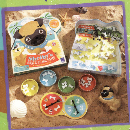
EI-3408 Shelby's Snack Shack Game™