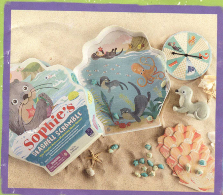
EI-3418 Sophie's Seashell Scramble™

Find more info on these adorable preschool games at educationalinsights.com